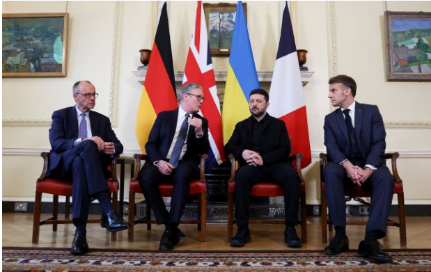
Фото: Фрідріх Мерц, Кір Стармер, Володимир Зеленський та Еммануель Макрон (Getty Images)

Найбільшою небезпекою для європейських країн сьогодні є політична нерішучість та складність ухвалення рішень через внутрішні розколи. І це є ризиком для України.