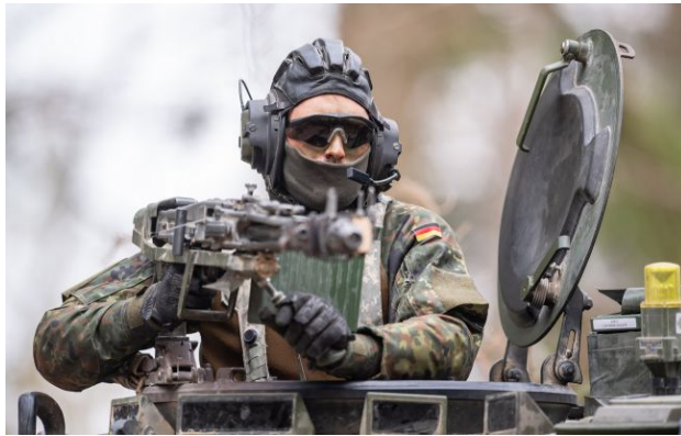
Фото: німецький військовий (Getty Images)

Німеччині досі не під силу багато з того, що зараз відбувається на полі бою. Водночас Бундесвер вже залучає українських інструкторів у сухопутні війська та копіює успішні ідеї України.