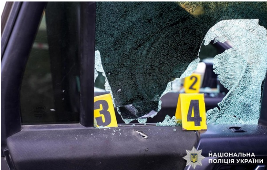
Обстріляний автомобіль працівників ТЦК

Зараз у Рівненській області проводиться спеціальна поліцейська операція. Відкрито кримінальне провадження за фактом замаху на умисне вбивство.