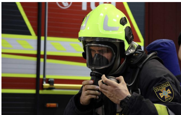
Фото: РФ атакувала передмістя Дніпра

Росіяни сьогодні вдень, 30 квітня, ударним безпілотником атакували передмістя Дніпра. В результаті обстрілу виникла пожежа, відомо про жертву та пораненого.