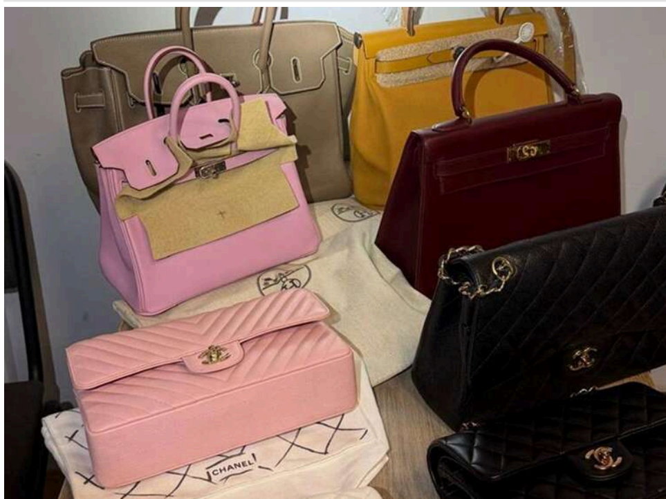
Люкс через «Ягодин»: волинські митники вилучили незадекларовані сумки Chanel та Hermes у пасажирів автобуса

Волинські митники виявили та припинили спробу незаконного ввезення до України жіночих сумок Chanel та Hermes без сплати податків.