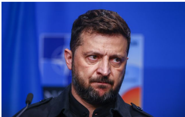
Фото: президент України Володимир Зеленський

Президент України Володимир Зеленський доручив своїм представникам зв'язатися з командою Дональда Трампа, щоб з'ясувати деталі російської пропозиції про "перемир'я".