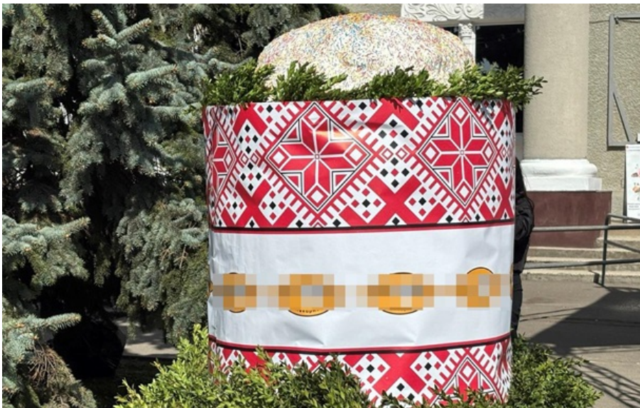
У Нововолинську до Великодня спекли 200-кілограмову паску

Після фіксації рекорду частування роздали всім охочим, водночас збираючи донати на потреби військових - зокрема для 39-го зенітного ракетного полку.