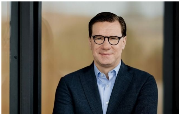
Фото: колишній голова апарату Міністерства оборони Федеративної Республіки Німеччина Ніко Ланге (ata-dag.de)

Берлін за три роки перетворився на одного з головних союзників України, але досі зволікає з ключовими рішеннями в обороні.