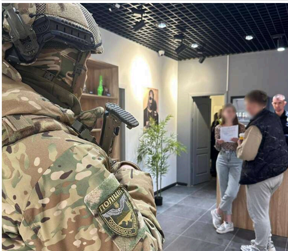
Масові обшуки в 6 областях: ОГП звітує про ліквідацію мережі U420, що збувала психотропи під виглядом сувенірів

Розкрито та ліквідовано мережу розповсюдження небезпечних речовин, замаскованих під сувеніри, - U420: здійснено понад 200 обшуків, – Офіс Генпрокурора.