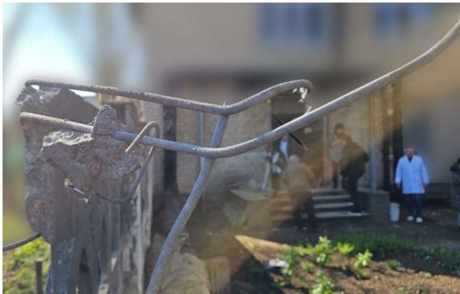
Росіяни продовжують воювати з лікарнями на Херсонщині

Унаслідок атаки постраждали четверо працівників лікарні: 67-річний чоловік та жінки віком 42, 51 та 39 років.