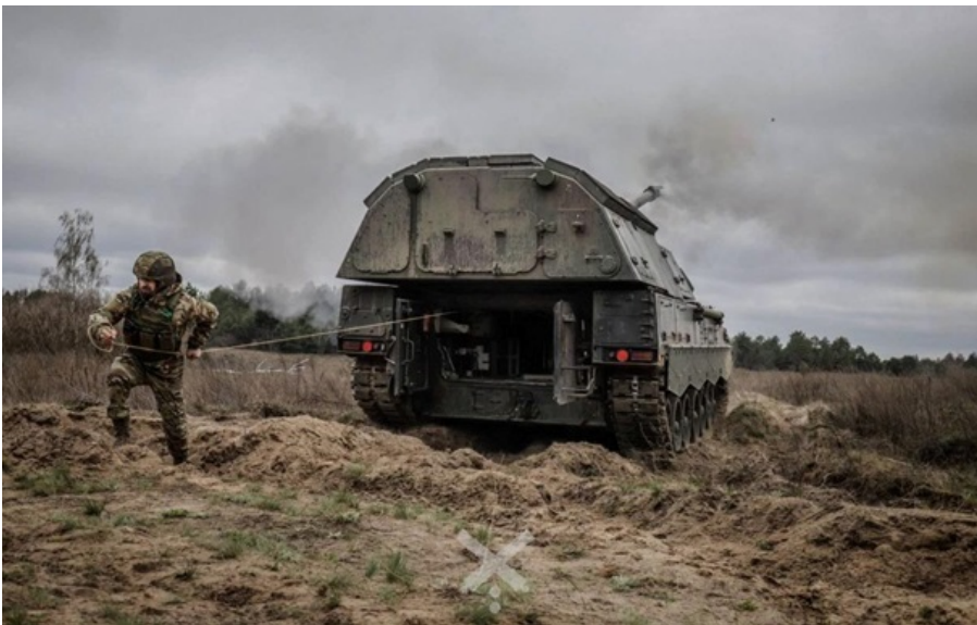
Фото: 43 ОАБр (ілюстративне фото) ЗСУ відбивають атаки РФ

Уражено 15 районів зосередження живої сили, два пункти управління, засіб протиповітряної оборони та пункт управління безпілотними літальними апаратами російських загарбників.