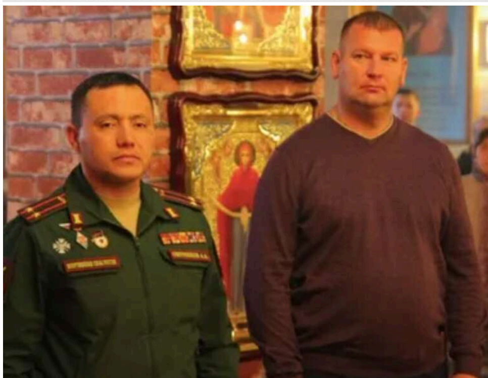
Вибухівка в поштової скриньці: у військовому гарнізоні Хабаровська стався підрих топофіцерів, причетних до звірств на Київщині

У російському Хабаровському краї 28 квітня у військовому гарнізоні пролунав вибух. Унаслідок інциденту загинув один із офіцерів, ще кілька людей отримали поранення.