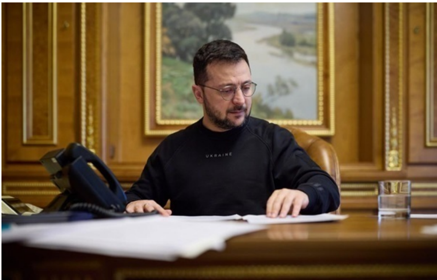
Зеленський підписав відповідний закон

Власники пошкодженого чи знищеного житла звільняються від оплати окремих житлово-комунальних послуг у період, коли об'єкт фактично непридатний для проживання.