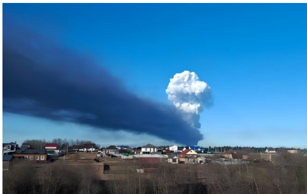
Фото: Другий день атак на Перм: у місті оголосили аварію і попередили про небезпечні речовини (росЗМІ)

У Пермі другу добу поспіль лунають вибухи. Після нового удару дронів у місті оголосили аварію з викидом небезпечної речовини, а в небі над містом здійнявся білий "гриб" диму.