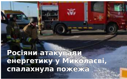
Росіяни атакували енергетику у Миколаєві, спалахнула пожежа