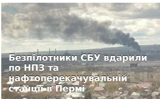
Безпілотники СБУ вдарили по НПЗ та нафтоперекачувальній станції в Пермі