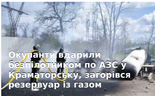
Окупанти вдарили безпілотником по АЗС у Краматорську, загорівся резервуар із газом