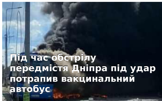
Під час обстрілу передмістя Дніпра під удар потрапив вакцинальний автобус