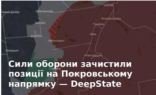
Сили оборони зачистили позиції на Покровському напрямку — DeepState