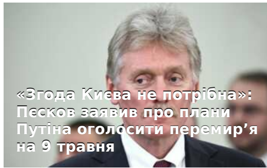
«Згода Києва не потрібна»: Песков заявив про плани Путіна оголосити перемир'я на 9 травня