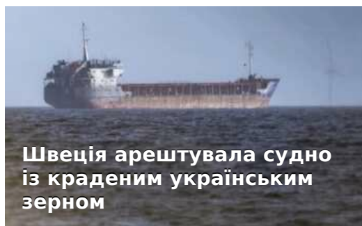
Швеція арештувала судно із краденим українським зерном