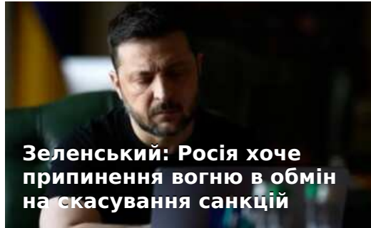
Зеленський: Росія хоче припинення вогню в обмін на скасування санкцій