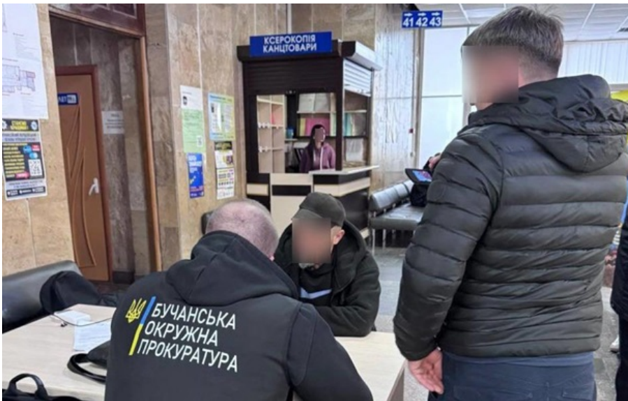
Слідчі повідомили обом фігурантам про підозру

Від шахрайських дій постраждали щонайменше 66 громадян, яким завдано збитки на загальну суму понад 35 млн гривень.