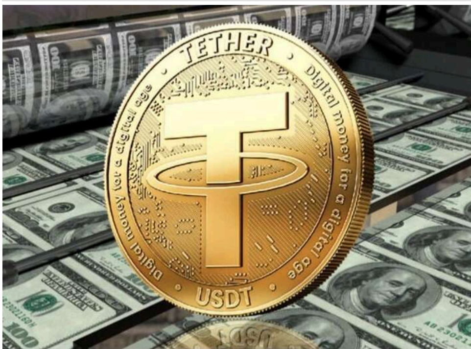
Казахстан заморозив понад 9 мільйонів доларів USDT у справі тіньового криптосервісу RAKS Exchange

Казахстан заморозив цифрові активи на суму понад 9,7 млн USDT у межах справи про діяльність одного з найбільших тіньових криптосервісів СНД – RAKS Exchange.