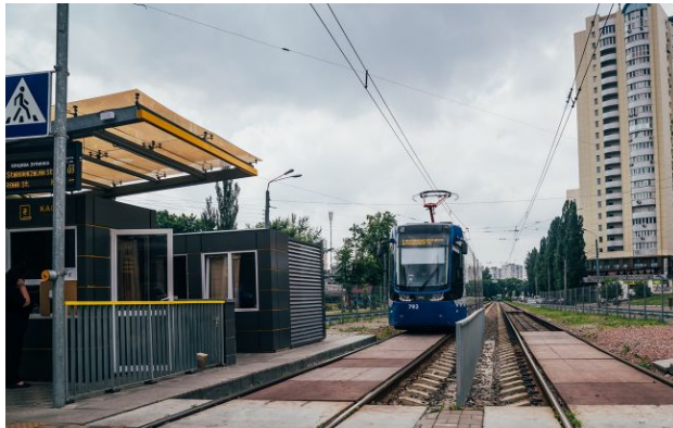
Фото: збої у графіках руху міського електротранспорту Києва

У Дніпровському районі Києва спостерігаються перебої зі світлом через пожежу на енергетичному об'єкті. На місці вже працюють профільні служби для ліквідації наслідків аварії.