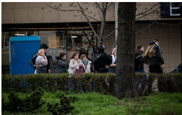
Фото: люди поряд з місцем, де сталася стрілянина у Києві

Чоловік, який влаштував сьогодні смертельну стрілянину у Голосіївському районі Києва, мав погашену судимість. Це дозволило йому мати зброю.