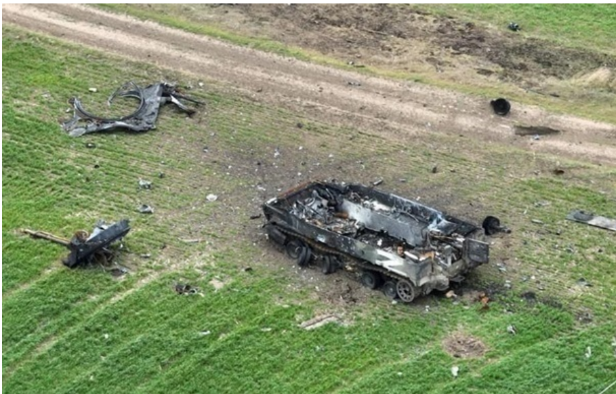
Генштаб підрахував нові втрати РФ

Загальні бойові втрати російських загарбників з 24.02.22 по 30.04.26 орієнтовно склали 1 330 290 осіб.