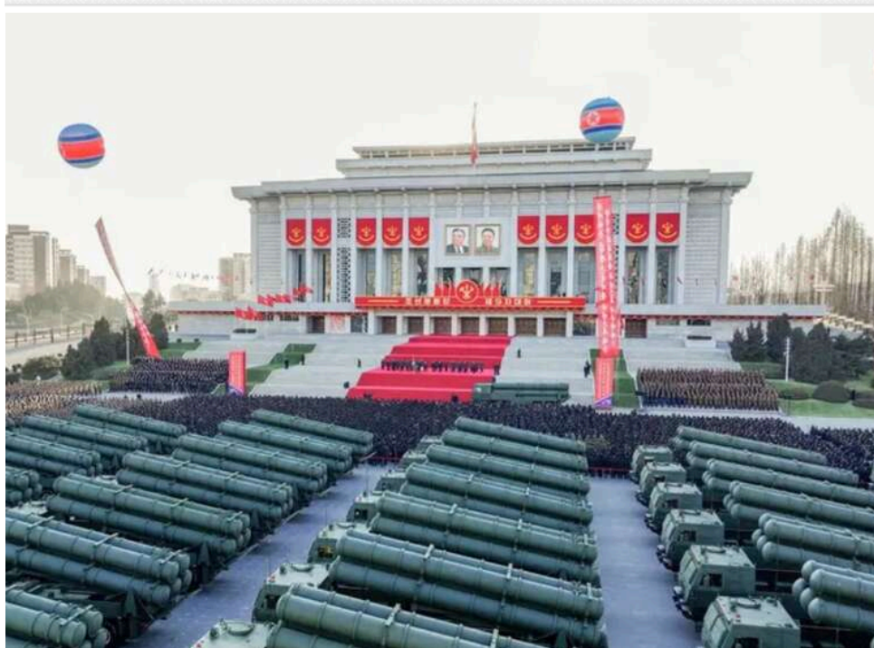
Ядерний арсенал Північної Кореї наближається до точки, коли може прорвати американську ПРО, — Bloomberg

Ядерний потенціал Північної Кореї стрімко наближається до рівня, який може змінити баланс безпеки у світі. За оцінками експертів, арсенал Пхеньяна вже зараз здатний створювати серйозні виклики для американської системи протиракетної оборони.