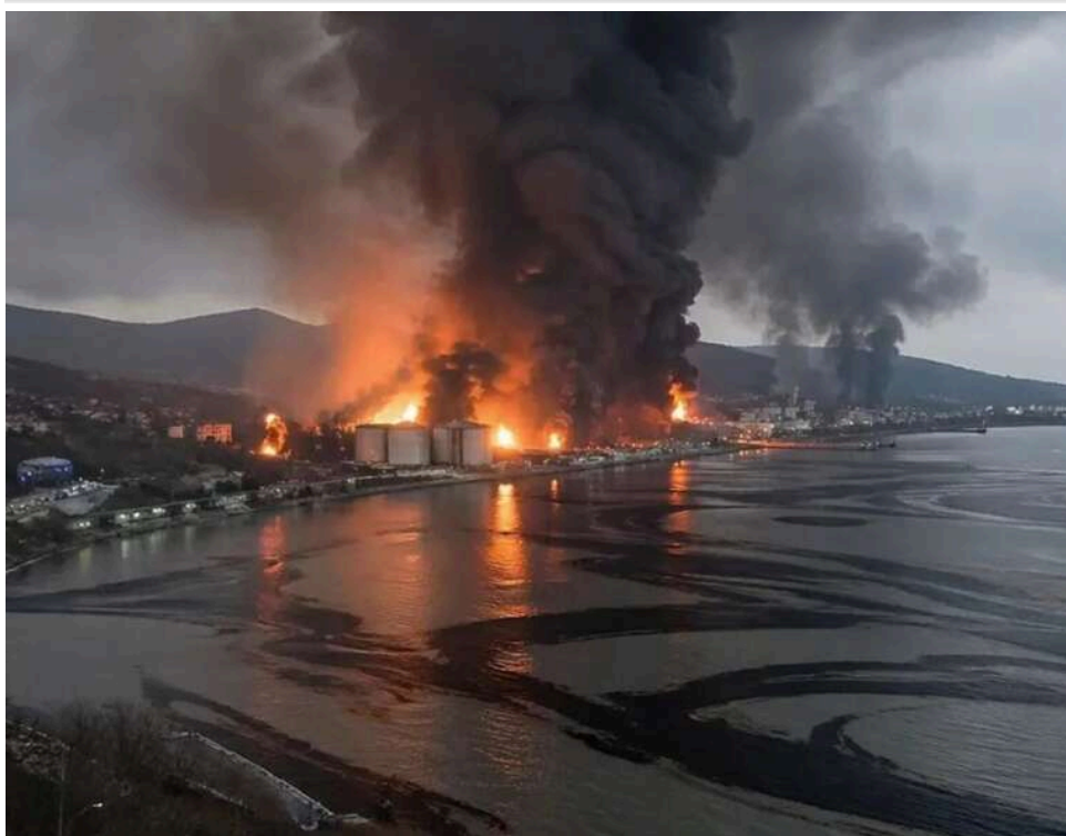
Україна перейшла до масованих ударів у глибокому тилу РФ, - ISW

Українські сили оборони значно масштабували кампанію зі знищення ключових об'єктів російської економіки та логістики. Квітень 2026 року став поворотною точкою, адже завдяки нарощуванню внутрішнього виробництва БпЛА, Україна перейшла до масованих ударів.