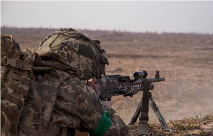
На Краматорському напрямку в районі населеного пункту Тихонівка українські оборонці відбили одну атаку

Українські підрозділи зупинили три атаки РФ поблизу острова Білогрудий та Антонівського мосту на Придніпровському напрямку.