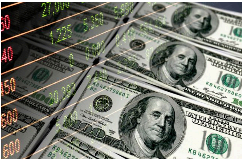
Фото: НБУ оновив офіційний курс валют на 11 травня