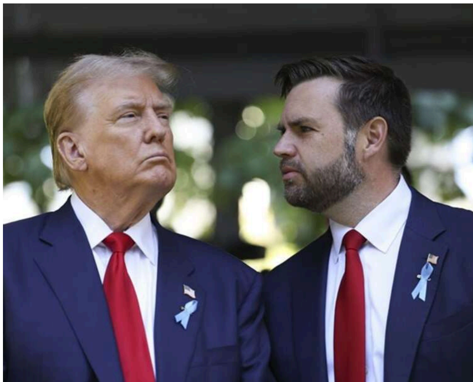
«Це просто жарт»: Венс прокоментував різкі випадки Трампа на адресу Папи Римського

Венс намагався виправдати Трампа за критику на адресу Папи Римського.