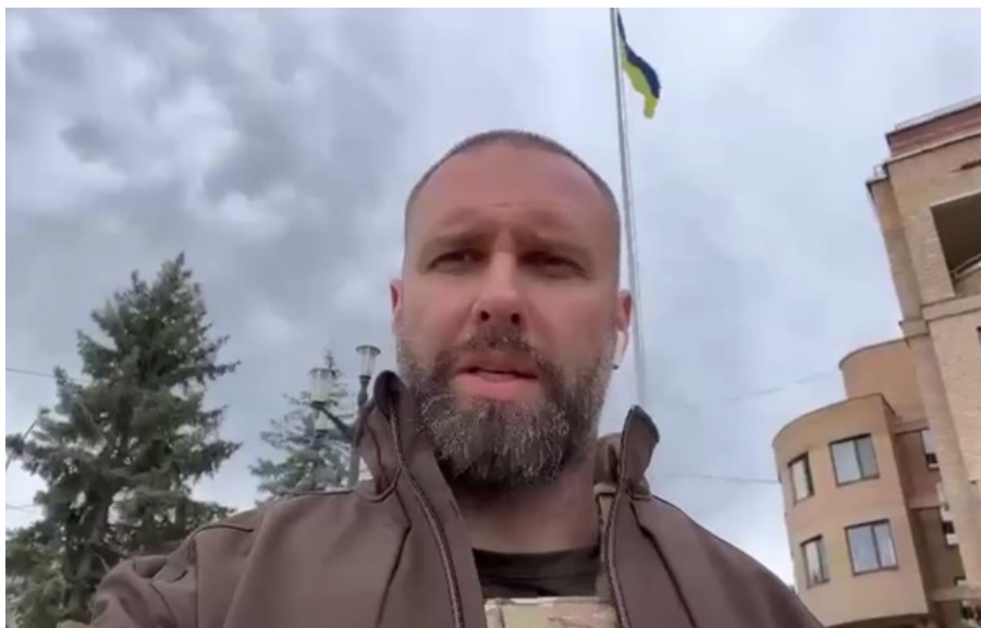
Начальник Харківської ОВА Олег Синегубов

Харківщина для росіян залишається пріоритетом, однак ЗСУ контролюють ситуацію і відбивають атаки.