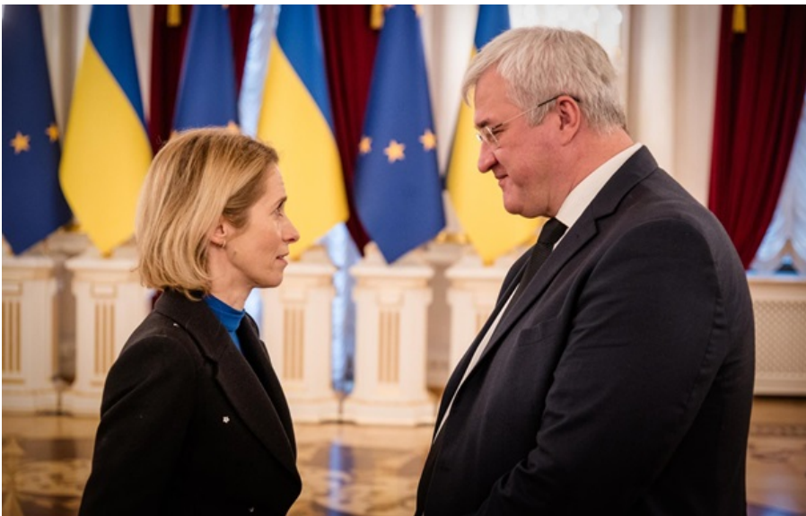
Сибіга наголосив на важливості схвалення кредиту у розмірі 90 млрд євро для України

Сторони також обговорили європейський порядок денний та необхідність збереження єдності в просуванні ключових рішень.