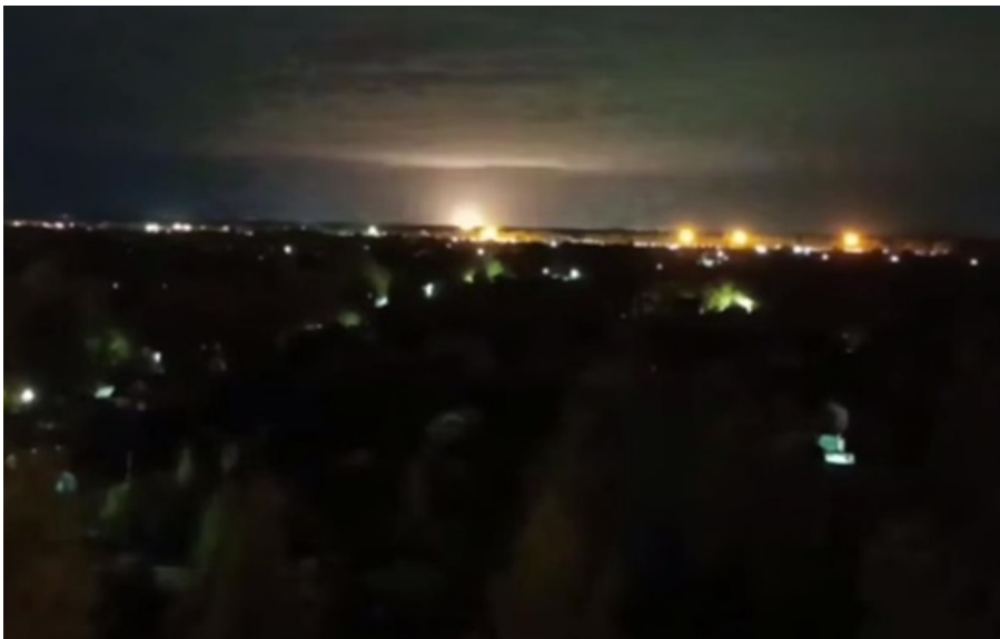
Вибухи прогрімали в районі заводу імені Свердлова

Дим здіймається з боку заводу вибухівки. Місцеві жителі скаржаться на вибухи у Нижньогородській, Волгоградській та Липецькій областях Росії.