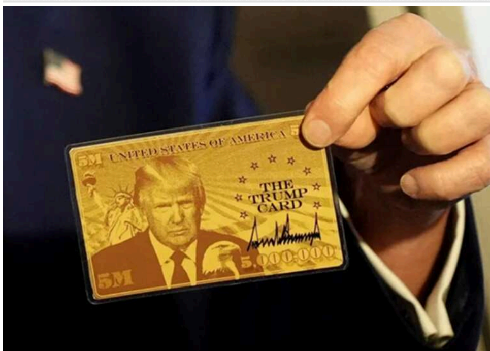
Гроші в обмін на громадянство: в США судяться через секретність програми «золотих віз» Трампа

У Сполучених Штатах розгорається свіжий скандал, пов'язаний з імміграційною політикою Дональда Трампа. Ініціатива так званої золотої візи, що дає дозвіл на проживання за значні інвестиції, опинилася в фокусі судового процесу.