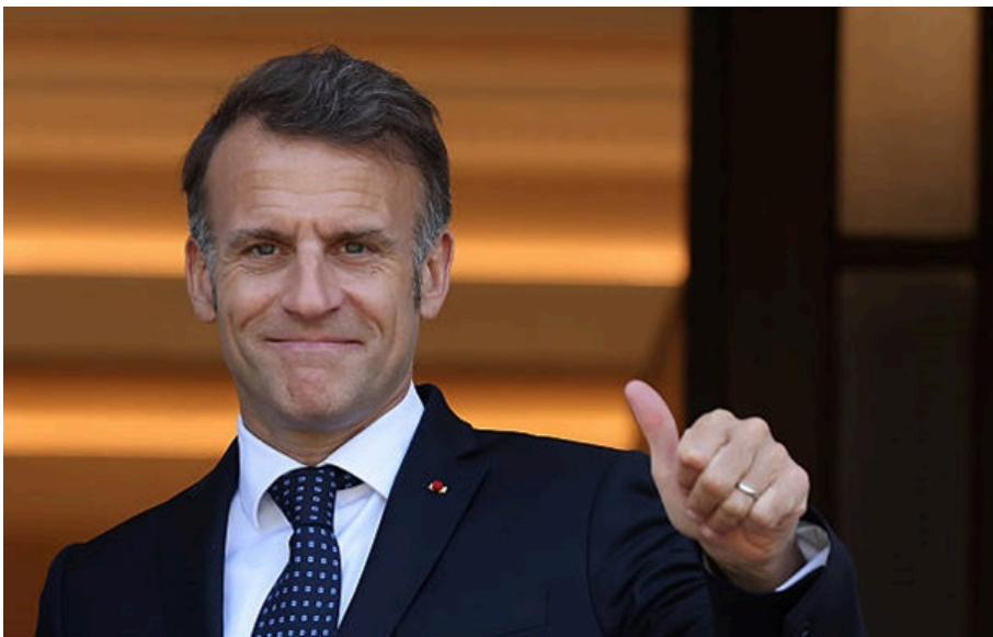
Президент Франції Емманюель Макрон

Французький лідер лаконічною фразою підтримав зауваження британського монарха щодо ролі двох країн в історії Америки.