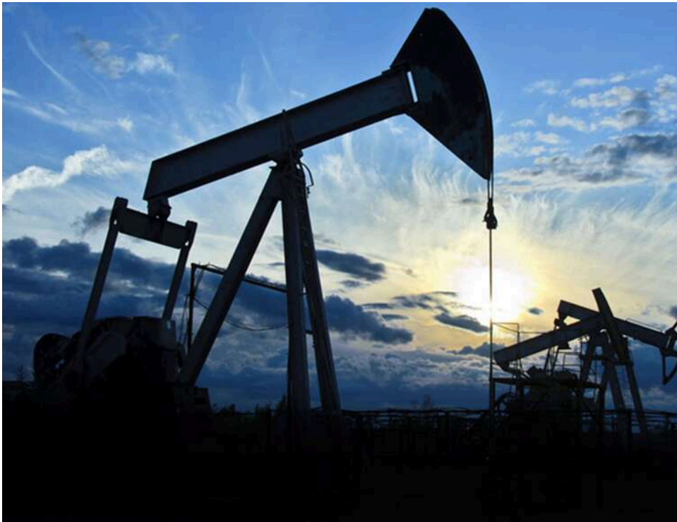
Російська нафта Urals «обігнала» Brent і злетіла до 114 доларів за барель

Вартість російської нафти злетіла до 114 доларів за барель.