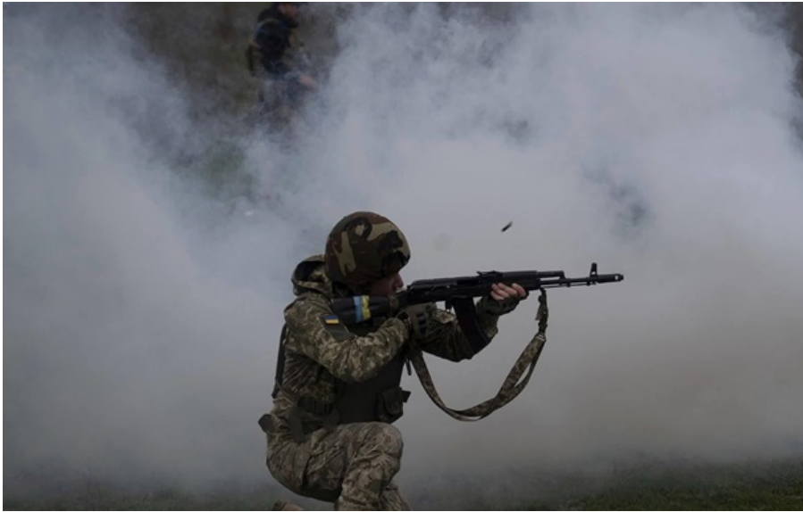
Українські оборонці за останні 24 години знищили два танки, три бронемашини та 38 артсистем ворога