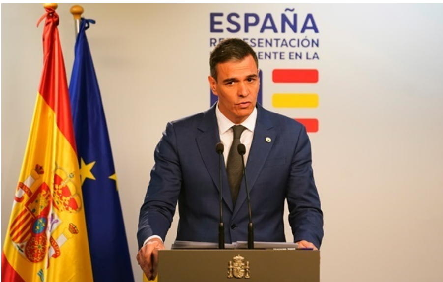
Прем'єр-міністр Іспанії Педро Санчес

Гomez заперечує свою провину, а прем'єр наполягає, що справа є замовленням з боку його політичних опонентів.