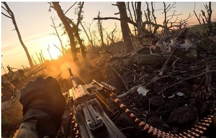
Ворог має просування на Сумщині

За добу площа червоної зони в зазначених населених пунктах зросла на 19,44 кв. км, сірої зони – на 52,01 кв. км.