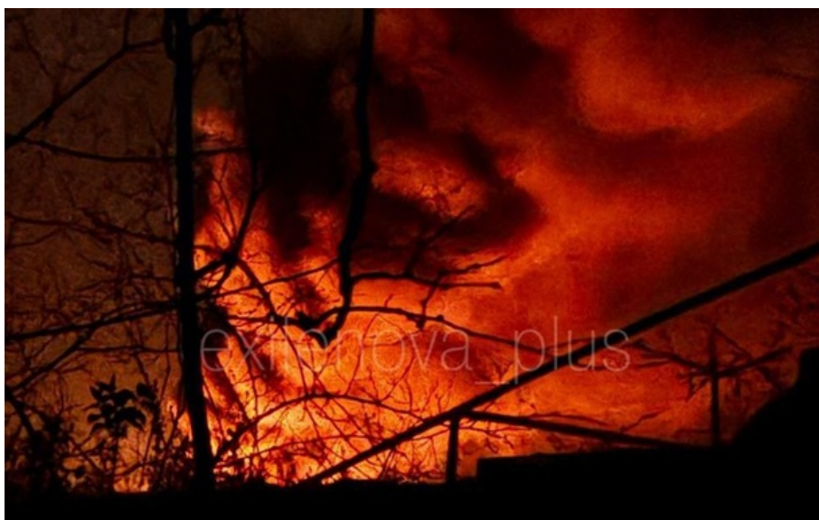
Пожежа на підстанції у Мелітополі

У Мелітополі вкотре уразили підстанцію, залишивши окупантів без електрики. Гучно було і в різних частинах Криму.