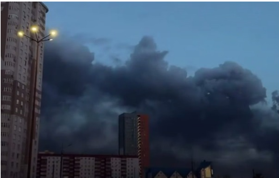
Загальні прямі втрати можуть сягати $75-112 млн

Візуально підтверджено, що вогнем охоплено два-три резервуари з паливом ЛДПС Пермь.