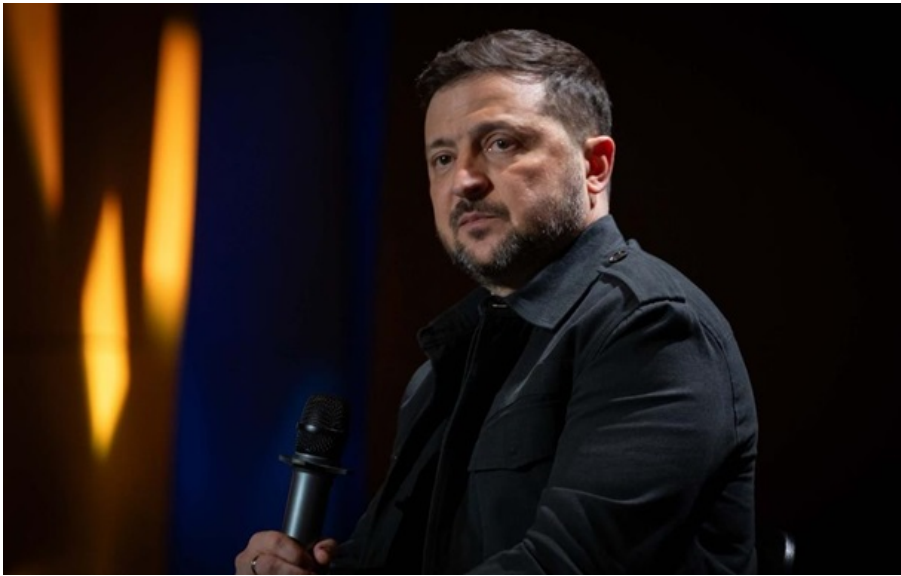
Президент Володимир Зеленський

Українці зараз перебувають на сильніших позиціях, ніж це було будь-коли протягом останніх століть.