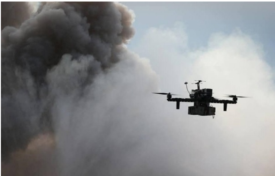
Російський БПЛА атакував цивільну вантажівку

Після влучання безпілотної машина загорілася, і шансів врятуватися у водія вже не було.