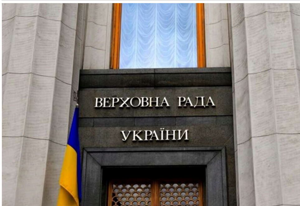
Верховна Рада підтримала законопроект про відновлення конкурсів на держслужбу

Верховна Рада 29 квітня підтримала за основу з урахуванням пропозицій, викладених у висновку головного комітету, та з доопрацюванням положень відповідно до ч.1 ст.116 законопроект № 13478-1, який передбачає відновлення проведення конкурсів для вступу на державну службу та вдосконалення порядку її проходження припинення.