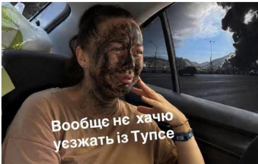
Українці жартують через екологічну катастрофу в Туапсе

Українські безпілотники втретє за два тижні вдарили по нафтопереробному заводу в російському Туапсе.