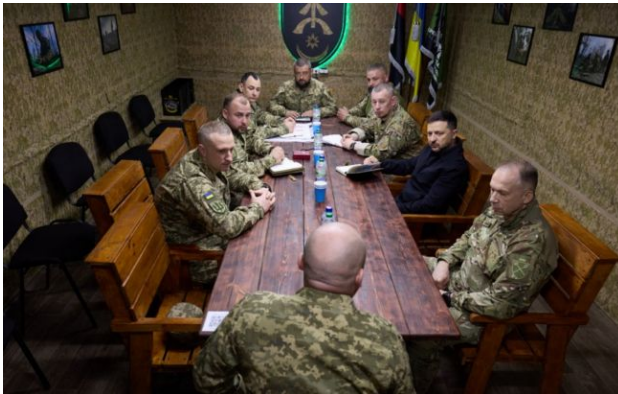
Зеленський нагородив бійців бригади, яка звільнила 12 населених пунктів на півдні

Обирайте перевірене - додайте РБК-Україна до улюблених джерел у Google