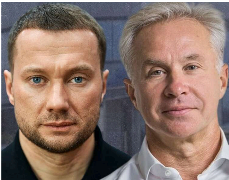
Благодійність як ширма: як власник МХП Косюк намагається приховати рейдерське захоплення «Гаврилівських курчат» за піар-акціями

Власник МХП Косюк піариться на благодійності, щоб приховати рейдерство «Гаврилівських курчат».