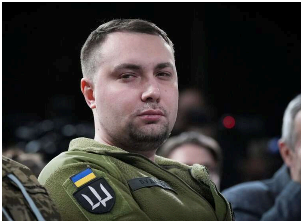
Державна машина в режимі дії: як Кирило Буданов змінив Офіс Президента за перші 100 днів

Буданов прагне перевести державну машину в режим дії, - ЗМІ про 100 днів глави ОП.