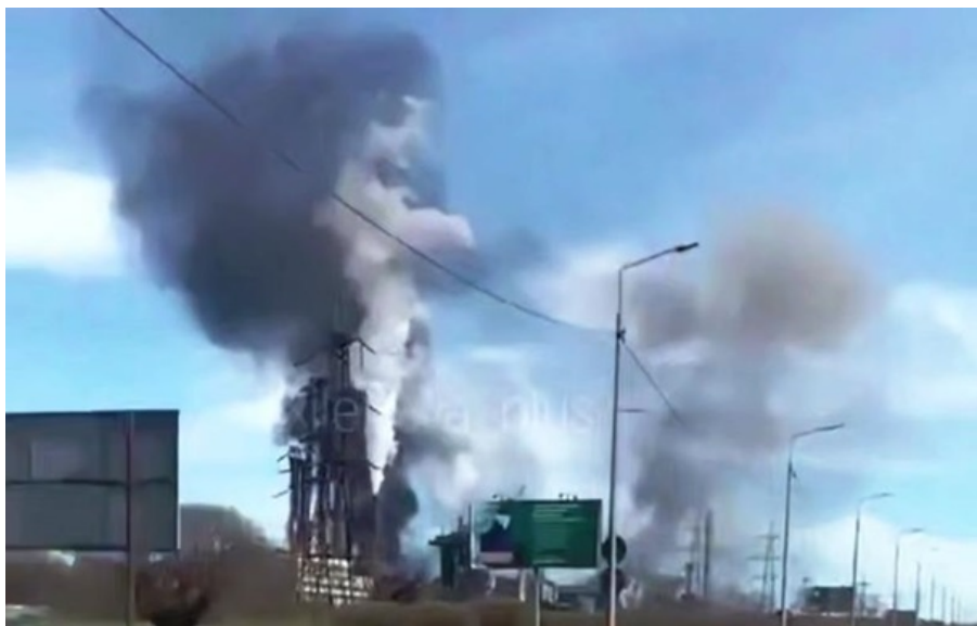
Наслідки атаки на хімзавод у Череповці

Українські безпілотники успішно атакували підприємство-гігант, яке виробляє сировину для компонентів боєприпасів.