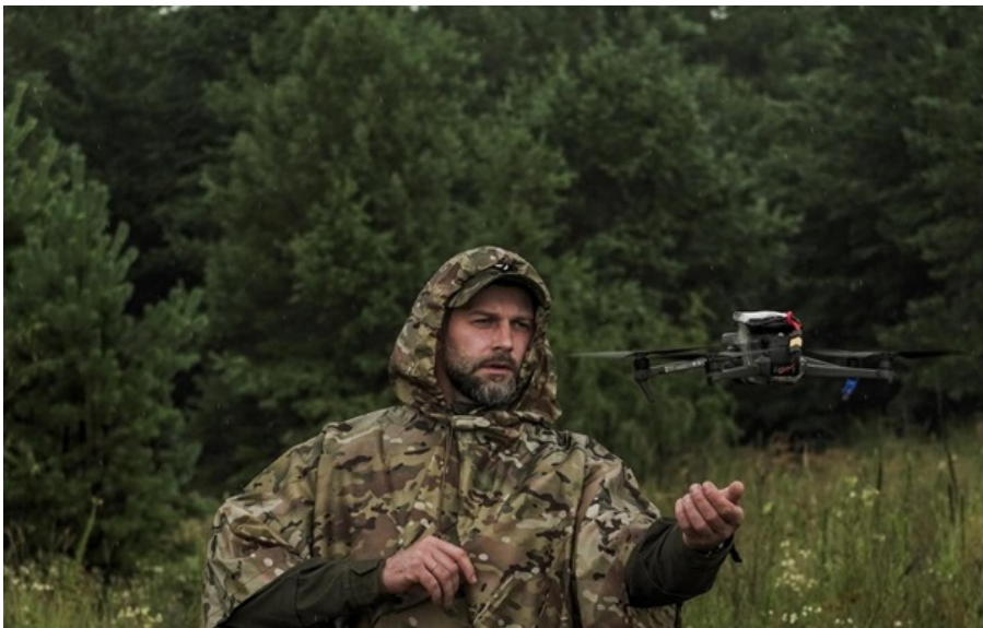
Фото: 1-ий корпус НГУ Азов / 1-а президентська бригада оперативного призначення Буревій Розвідувальні дрони Азову вже пантрують за російськими загарбниками в окупованому місті (ілюстративне фото)