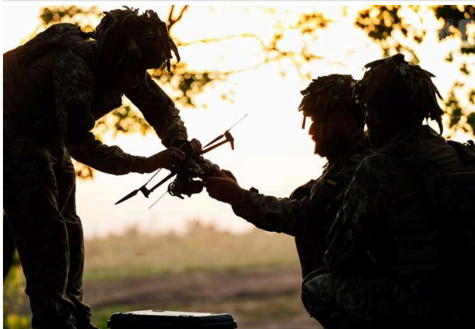
Ситуація на фронті: понад 100 боєзіткнень за добу, ворог посилив тиск по всій лінії фронту

Від початку доби 13 квітня на фронті сталося 104 бойові зіткнення.