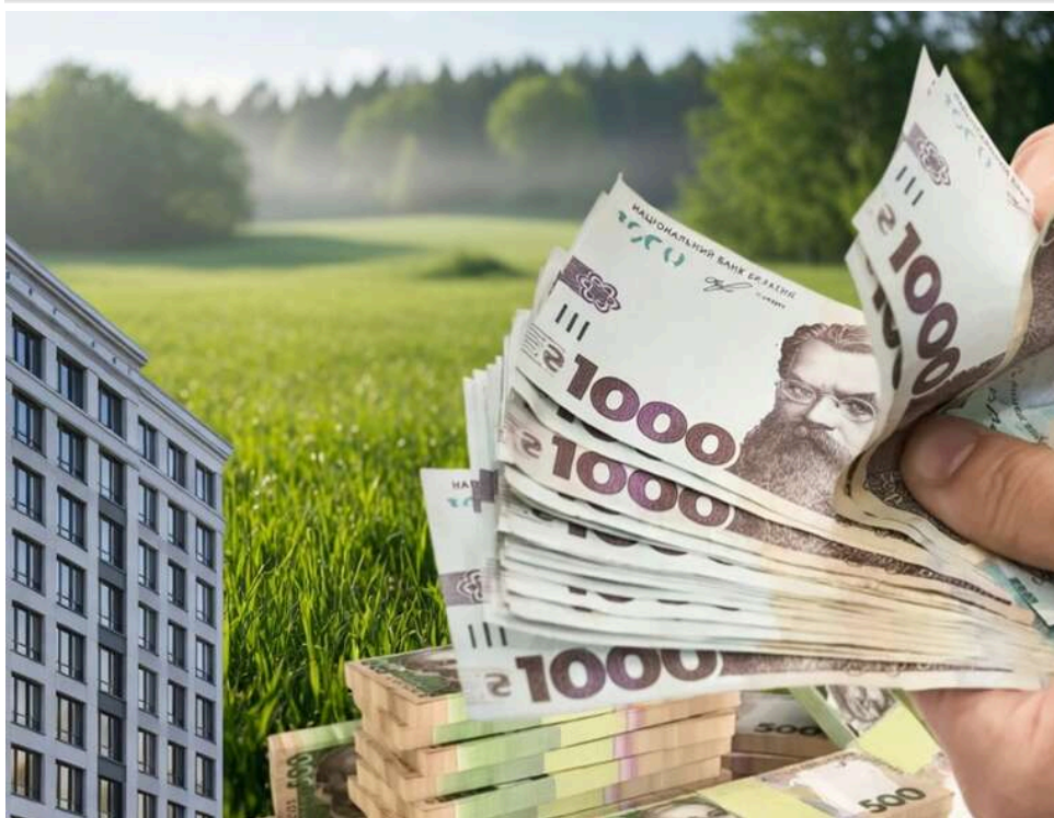
Життя «під парканом»: чому кожен десятий український держслужбовець не вказує нерухомість у декларації

Тисячі держслужбовців «сплять під парканом»: близько 46 тис. посадовців роками не декларують жодної нерухомості.