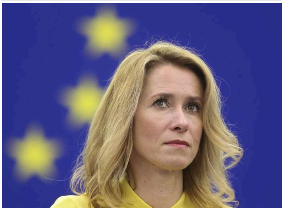
Каллас в ООН: Росія чинить найтяжчий злочин проти міжнародного права за останні десятиліття

Глава дипломатії ЄС Кая Каллас заявила, що агресія Росії проти України є грубим порушенням міжнародного права.