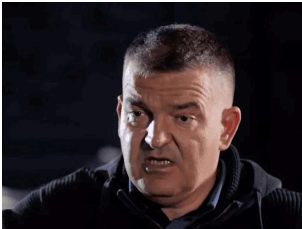
Несмішне кіно Дениса Штілєрмана, або Що не так із «головним конструктором Flamingo»

Офіційна біографія Дениса Штілєрмана сьогодні виглядає майже ідеальною: геніальний інженер, автор інноваційних оборонних розробок, людина, яка стоїть за проектами ракет і дронів, зокрема, навколо бренду Fire Point і розробки ракет Flamingo.