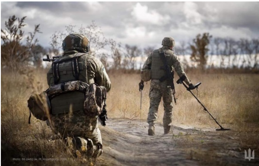
Фото: 66 ОМБр (ілюстративне фото)

Коаліція з розмінування залучила додаткові 2 млн євро для України